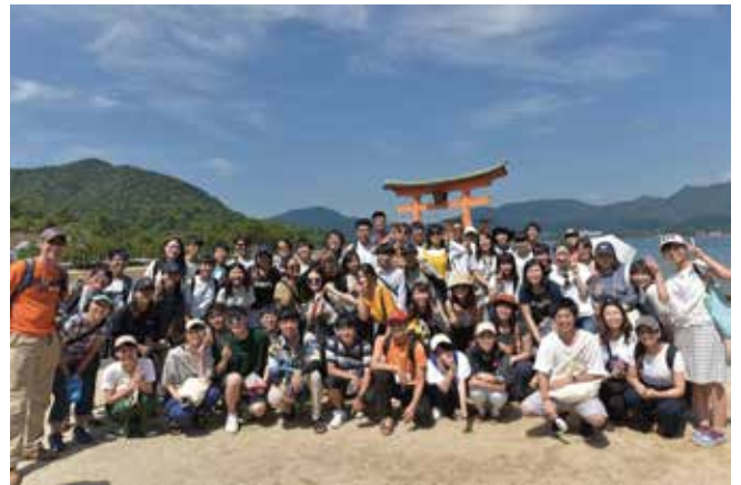
宮島観光 大鳥居の前で記念撮影