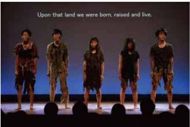
平和創作劇「I PRAY」の演劇鑑賞