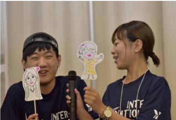
ワークショップの最後は、自分達が考える平和を人形劇として発表しました。