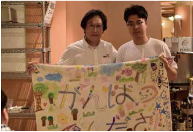
テグYMCAからは韓国の幼稚園の子ども達が描いた豪雨災害にあった方々を励ますメッセージが贈られました。