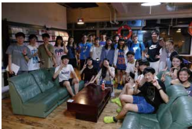
8/3 海外から広島にユースメンバーが到着しました。ホノルルからの14名が加わり、8/4からYMCA国際青少年平和セミナーが始まります。

【協力】 広島県原爆被害者団体協議会、バプテスト広島教会、ワイズメンズクラブ・メネット 他