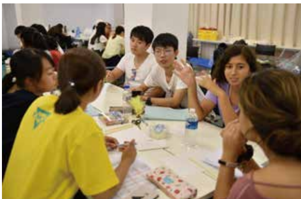
午後からのワークショップでは、活発なディスカッションが行なわれました。