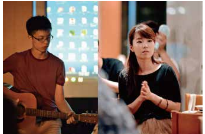
明日の帰国を前にみんなで「カントリーロード」を合唱