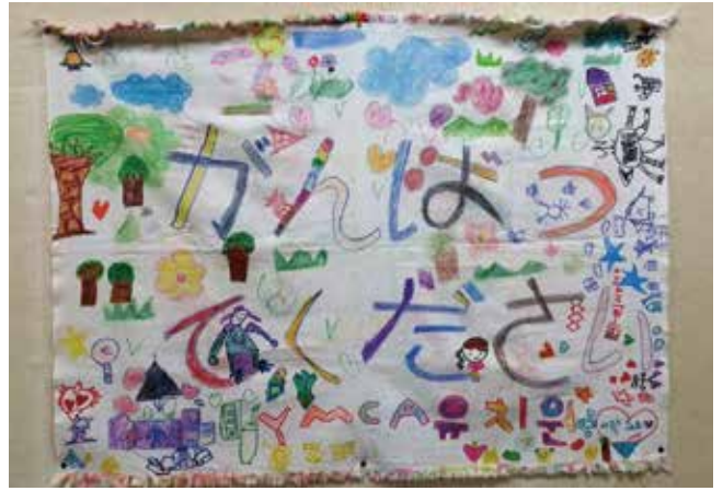
これには広島YMCAのスタッフのみんなも感動しました。