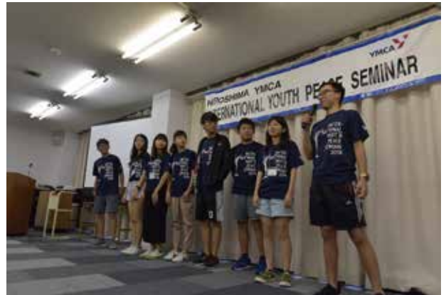
セミナーのまとめは各国の代表からセミナーを通しての感想を話してもらいました。（写真は台南YMCA）