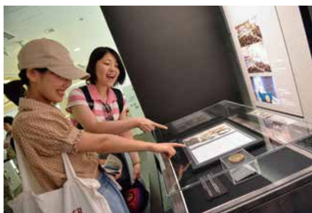
ノーベル平和賞・受賞メダルを資料館で見学