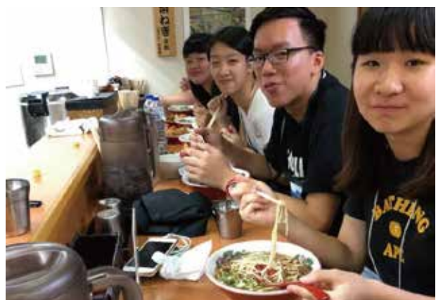
広島タウンウォークで、「広島で食べたい夕食に行こう」を開催。グループに分かれて街に出ました。台湾チームは、日本の尾道ラーメンを選択！！