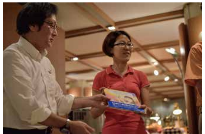
各YMCAへ広島YMCAからプレゼント