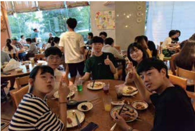
フェアウエルパーティーでセミナーのまとめを行います。