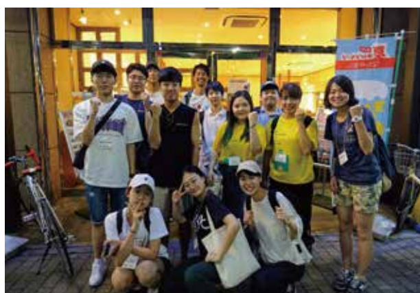
韓国(ウルサン・テグ)・東京YMCA・学Y合同で「和定食」を食べました。