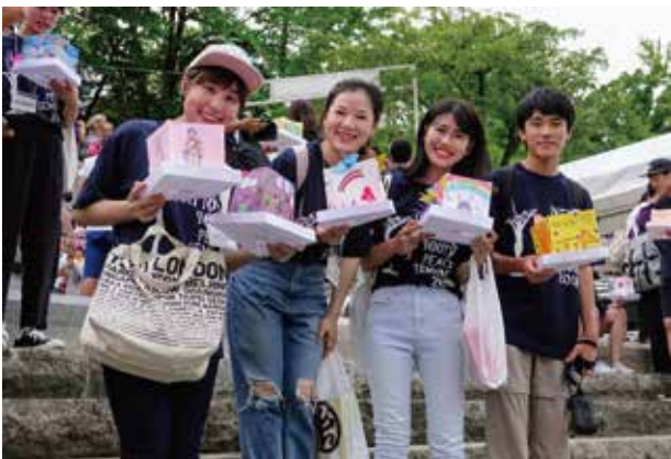
最後の平和プログラム・ピースランタンでは、世界中の子ども達から届いた平和のメッセージでとうろうを作りました。