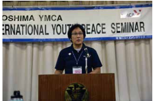
広島YMCA 殿納総主事の歓迎挨拶