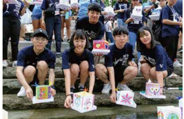
今年で14回目を迎えるピースランタン。毎年、セミナーの参加者が平和への祈りを込めて元安川に浮かべています。