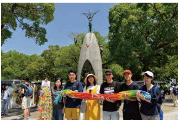
平和公園フィールドワークにて各国の代表が原爆の子の像に千羽鶴を献納

セミナー終了後、食べたいもの別にグループに分かれて夕食に出かけました。(グループ分け：うどん、パスタ、日本定食、ラーメン、ハンバーグ etc) 海外組は初めての日本食チャレンジです。