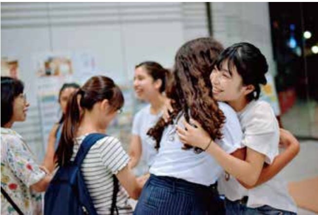
最後のセレモニーでは、みんなハグをして別れを惜んでいました。