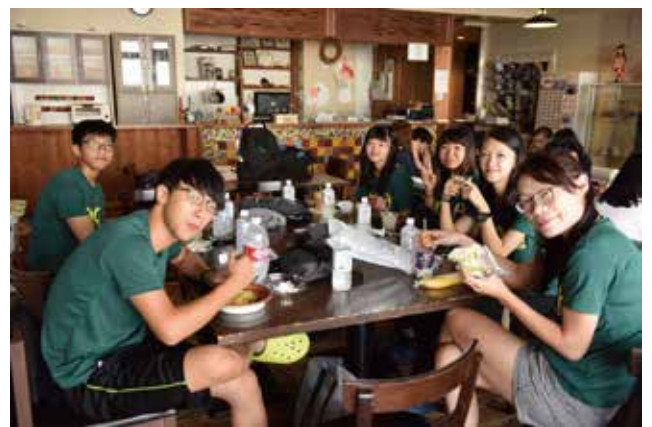
今年も宿泊でお世話になったのがシンプルステイ平和公園前さん。多くのユースが8月6日に集える場所として、YMCAにとって、なくてはならないパートナーです。