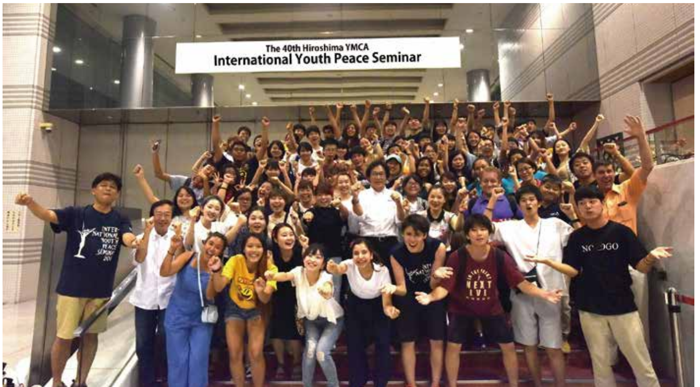
たくさんの思い出を胸に、8/8 全員帰国しました。若者一人ひとりが深くつながり、共に語った平和への思いが将来花開くことを期待しています。