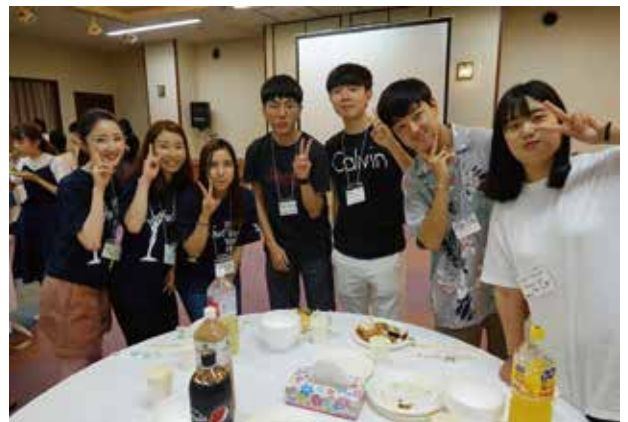
各国ユースからプレゼンが行われたウエルカムパーティー