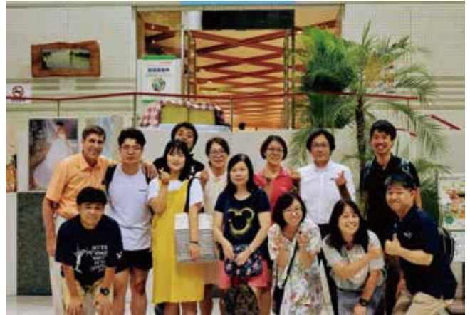
国内外のユースを引率してくれたスタッフ同士も仲良くなり、最後の記念撮影。各YMCAに戻っても広島の日々のことを思い出してください。