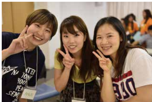
この頃には緊張も解け、多くの仲間ができました。(ユースリーダー・学Y・横浜Y留学生とスナップ)